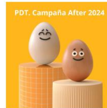
Input caption text here. Use the block's Settings tab to change the caption position and set other styles.

Con el objetivo de llegar a los más pequeños y a sus familias para introducirles en las preguntas que habitualmente surgen sobre este alimento excepcional, se ha realizado el encarte del libro en XXXX con una tirada nacional de XXXX ejemplares y un público afín a este objetivo.