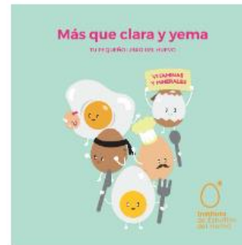
Encarte libro "Más que Clara y Yema. Tu pequeño libro del huevo"

En este sentido, se realizó una infografía en la que se informó sobre los sistemas de producción de huevos de la UE, del código marcado en el huevo y de la información de la etiqueta de los huevos. Además, se difundió una nota de prensa en la que se profundizó sobre esta revisión de las normas de comercialización.