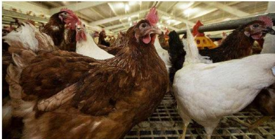
Las gallinas criadas en el suelo pasarán a denominarse «ponederos sueltas en gallinero».

Agricultura ha precisado que aunque la normativa comunitaria es de directa aplicación en todo el territorio de la Unión Europea desde el momento en que entre en vigor, existen determinados aspectos que requieren de la regulación y el control de los Estados miembros, para lo que es necesario desarrollar regulación nacional para su