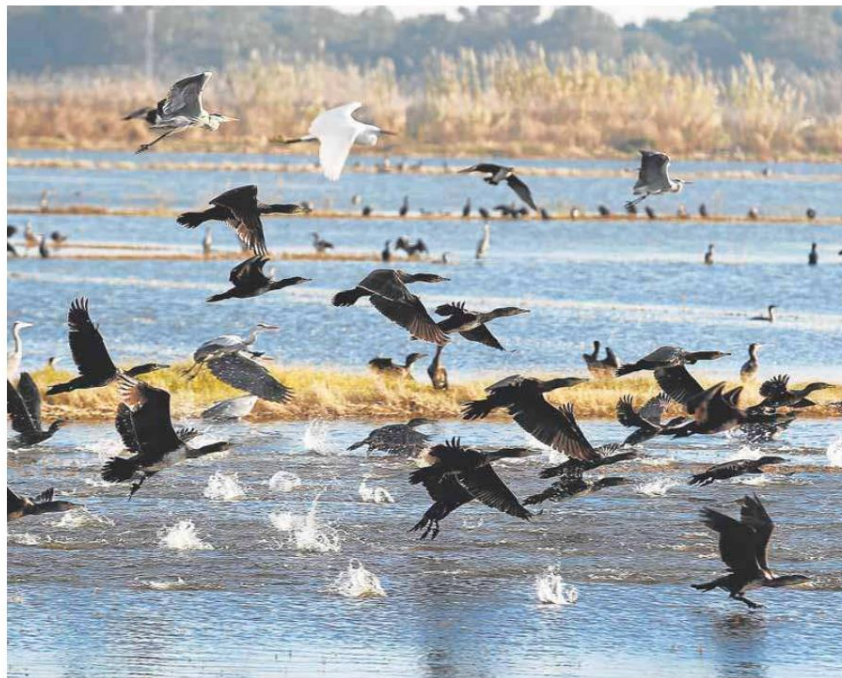
Una bandada de pájaros en el parque natural de la Albufera. JESÚS SIGNES

También señala la necesidad de que los depósitos de agua situados en el exterior para deter-